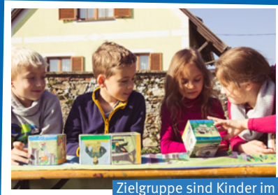
Zielgruppe sind Kinder im Alter von 4 bis 10 Jahren.

Dieses Verständnis legt den Grundstein für nachhaltiges Denken und Handeln in ihrem zukünftigen Leben und stärkt das Bewusstsein der Gesellschaft. Die Spielekiste gewährt den Kindern einen Einblick, regt zum Lernen an und ermöglicht es den Kindern, sich ein eigenes Bild über die Landwirtschaft in Österreich zu bilden.