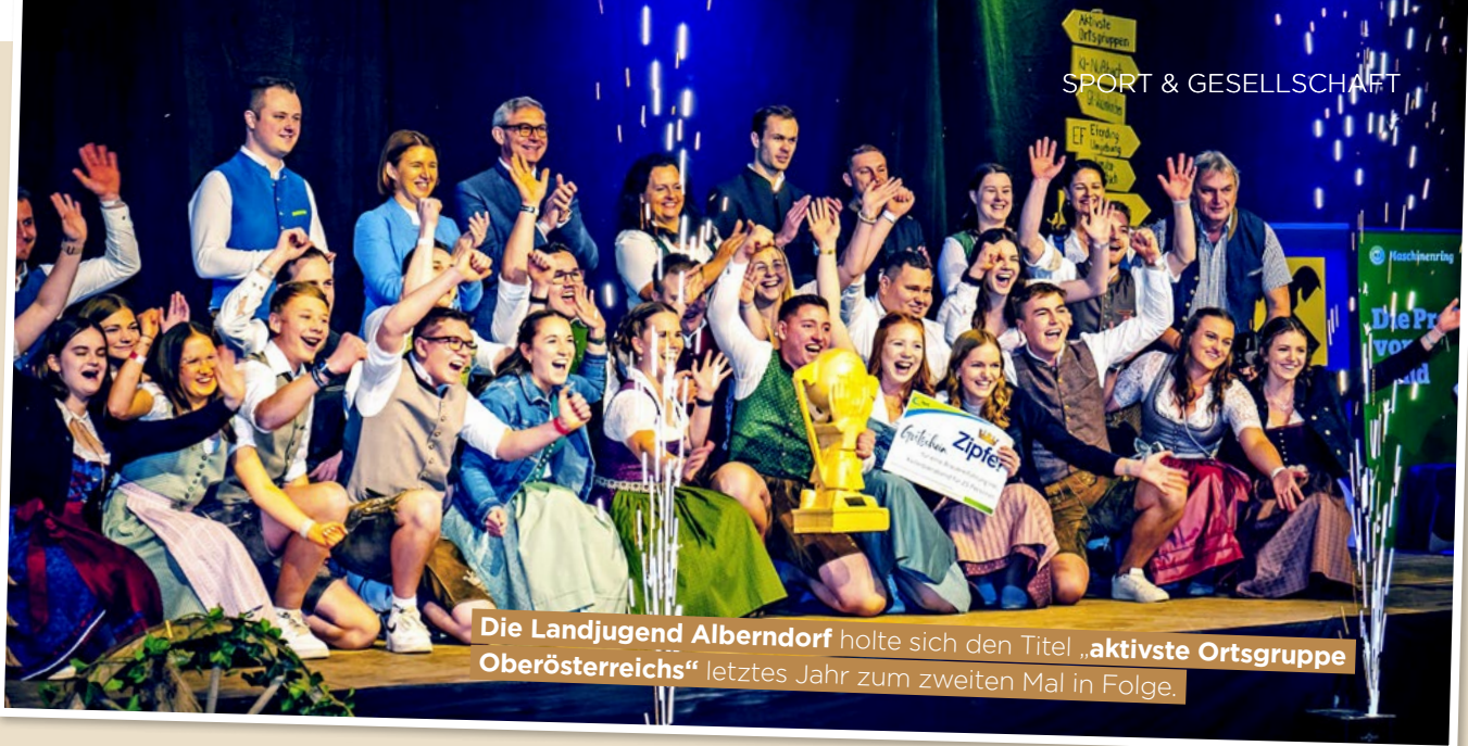
Die Landjugend Alberndorf holte sich den Titel „aktivste Ortsgruppe Oberösterreichs“ letztes Jahr zum zweiten Mal in Folge.