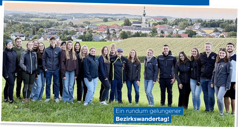
Ein rundum gelungener Bezirkswandertag!

Im Rahmen des Projekts „Geh mas o“ wurde eine von einer Ortsgruppe gestaltete Route aus dem Wanderbuch ausgewählt. Heuer führte die Wanderung nach Aspach, mit Zwischenstopp bei der 100-jährigen Stibler Linde, einem Naturdenkmal. Danach stärkten sich die Wanderer beim Danzer.