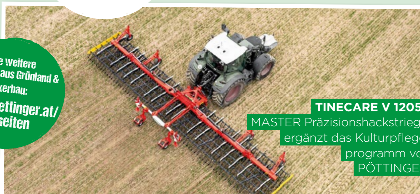
TINECARE V 12050 MASTER Präzisionshackstriegel ergänzt das Kulturpflege- programm von PÖTTINGER .

Mit hoher Flächenleistung und geringen Nutzungskosten überzeugt die Scheibenegge TERRADISC HT 12000 . Die gezogene, horizontal geklappte Scheibenegge mit 12,5 Metern Arbeitsbreite ist ausgelegt für den schlagkräftigen Einsatz mit Traktoren zwischen 450 und 720 PS. Das Herzstück der Scheibenegge stellt das etablierte TWIN ARM System mit zwei Scheibenträgern und Hohl scheiben je Klemmschale dar. Dadurch halten die Scheiben auch bei schweren und trockenen Bedingungen ihre Position ohne seitliches Ausweichen.