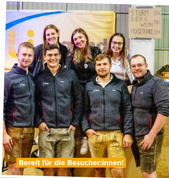
Bereit für die Besucher:innen!