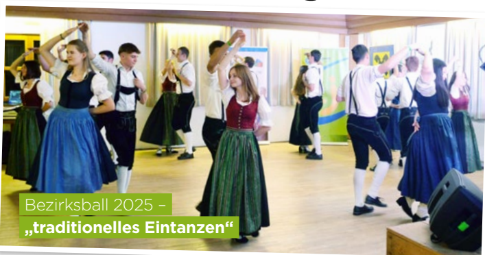
Bezirksball 2025 – „traditionelles Eintanzen“

Gemeinsam mit der Ortsgruppe Dimbach lud die Landjugend Bezirk Perg zum traditionellen Bezirksball ein. Heuer fand der Ball das erste Mal im ehemaligen Gasthof zur Post in Naarn statt. Musikalisch umrahmt wurde der Abend von der Brassband „d'Aushüfn“. Mehrere Bars, ein umfangreiches Rahmenprogramm und verschiedene Tanzeinlagen sorgten für eine ausgelassene Stimmung bei den Ballgästen und für einen gelungenen Abend.