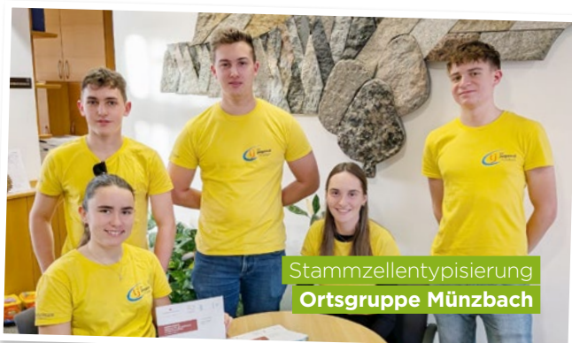
Stammzellentypisierung Ortsgruppe Münzbach