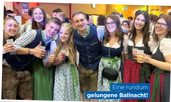
Eine rundum gelungene Ballnacht!

Nach dem feierlichen Auftanzen konnten die Gäste den Abend in den verschiedenen Bars genießen. Für großartige Stimmung sorgten „Vöckla-blech“ sowie die „Hippinger Schuhplattler“ mit ihrer einzigartigen Miternachtseinlage.